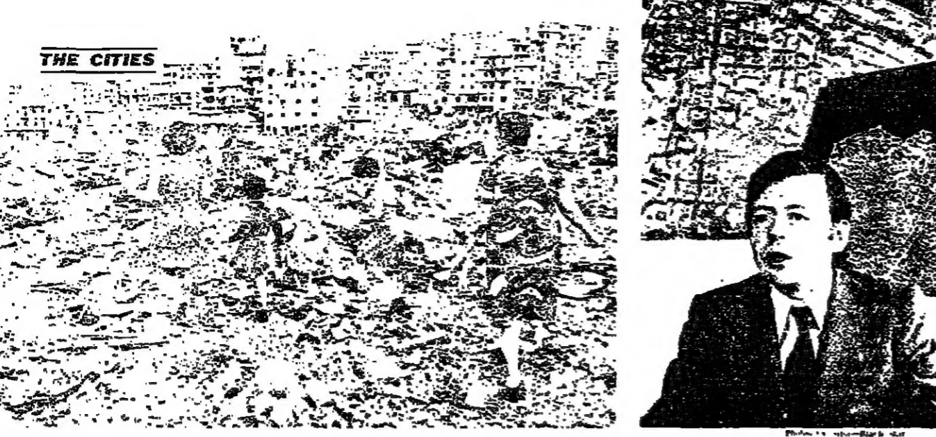
A Lebanese family probing the wreckage of the capital. French urban planner Liang: 'We don't want Beirut to lose its soul'

المستقبل كبحل ومكاتب ومطاعم وصالات عرض وما شابه . هذا التصميم الجديد للسيد ليان ، يتناول بجملته الأماكن والآبنية التي هدمتها الحرب .